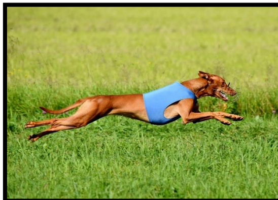
Hetsjakt er ikke lovlig i Norge. Faraohundene får derimot utløp for jaktinstinktet sitt på lure coursing – rasens fremste bruksprøve – der de jager en simulert kanin i form av ei plastfille. I lure coursing blir de vurdert etter fart, utholdenhet, bevegelighet, intelligens og entusiasme. Legg merke til den lange, velutviklede muskulaturen.