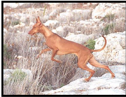
Faraohund i arbeid på Malta – ved hjelp av syn, luktesans og hørsel jager de kanin på Malta. Legg merke til det utfordrende, steinete terrenget, som er typisk for de maltesiske øyene. Sitat fra rasestandarden: «Meget hurtig med frie, lette bevegelser og våkent uttrykk».

Rasen har ingen brukskrav for å bli norsk utstillingschampion, men kan konkurrere i bruksprøvegrenen lure coursing , som innebærer en simulert kaninjakt der hundene jager en «lur» i form av en plastfille i en bane som skal etterligne et jaktbyttes flukt på et stort jorde. Hundene bedømmes etter fem punkter: utholdenhet, bevegelighet, fart, intelligens og entusiasme. Og er det noe faraohunden ikke mangler, så er det entusiasme! De fleste faraohunder bjeffer under jakt, og deres jaktbjeff heter «kurriera» på Malta. Det er sjelden man ser sin faraohund så lykkelig som de er på lure coursing -banen. Der får de virkelig utløp for det jaktinstinktet som fremdeles er svært velutviklet hos de fleste faraohunder.